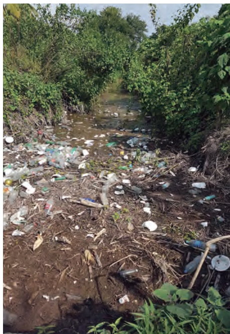
Figura 52. Barranca contaminada, colonia El Muelle. Foto: Barreto, 2018

Es por esto que, el depósito de basura en las barrancas y calles, establece un ciclo continuo de contaminación,