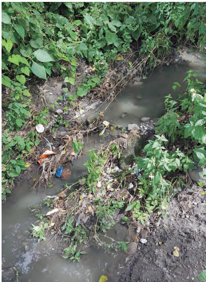
Figura 53. Basura arrastrada por las lluvias, colonia Narvarte.

La contaminación en las barrancas es porque la gente tira basura, eso provoca olores feos y puede causar enfermedades respiratorias (cartografía de riesgo, grupo 1° D, Secundaria Técnica No. 20 Cuauhtlitzin, 2017).