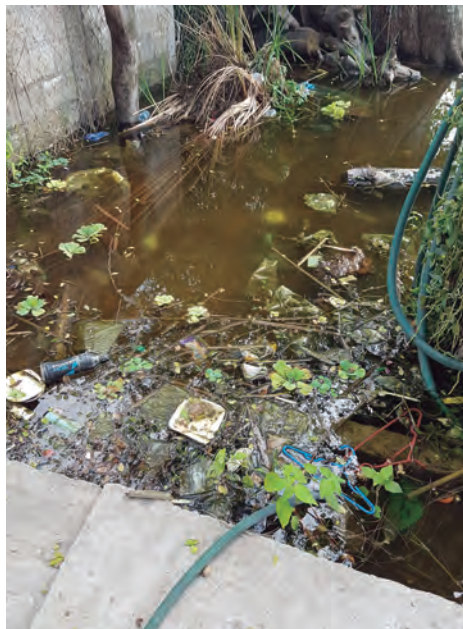
Figura 56. Contaminación en la zona de palapas, colonia El Muelle.

evitar tener que cerrar su negocio de palapas. No obstante, el no tener drenaje y un buen sistema de recolección de basura, tiene como consecuencia que todos estos desechos vayan a dar a la laguna y, por ende, que ésta se contamine (figuras 56 y 57).