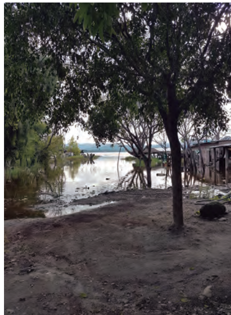
Figura 57. Terreno nivelado con tierra junto a la laguna, colonia El Muelle.