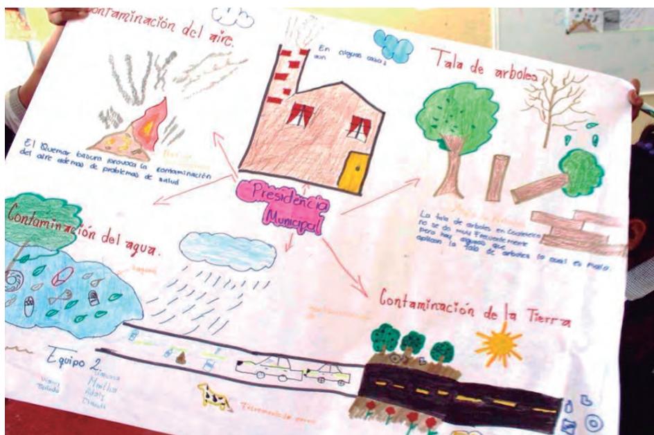
Figura 51. Cartografía de riesgo, Secundaria Técnica Cuauhtlitzin, grupo 2° C.

Con base en el análisis de las cartografías elaboradas por las y los adolescentes de entre 13 y 15 años de edad, de la escuela secundaria técnica No.20 Cuauhtlitzin, así como la aplicación de entrevistas a población abierta, fue interesante ver la percepción que tuvieron las alumnas y alumnos de los diferentes grados de secundaria, en cuanto al reconocimiento de su entorno y de los factores que contaminan las fuentes de agua en su comunidad (figura 51). En este sentido, la mayoría de los equipos fueron claros al plasmar y decir que la principal fuente de contaminación hacia la laguna de Coatetelco, es la basura.