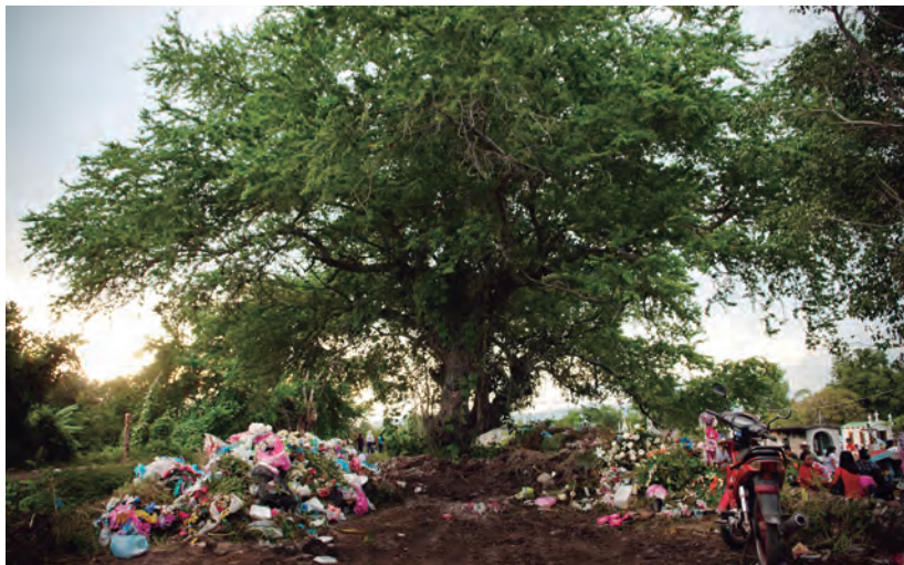
Figura 54. Adornos tirados en la vía pública después de la celebración a San Miguel, colonia Saavedra.

En esta imagen se muestra el caso de la barranca junto al panteón en la colonia Saavedra, la cual se cubre de basura provocado por los adornos que dejan las festividades (figura 54). Por ejemplo, las coronas de flores y “pancitas” de plástico utilizadas cada año para decorar las cruces en vísperas de San Miguel el 28 de septiembre. Por lo anterior, no se trata de hacer referencia a la fiesta sino al problema que resulta de la falta de contenedores públicos para el desecho de los adornos.