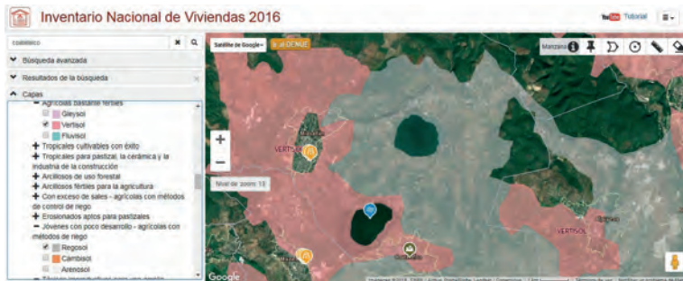
MAPA 3. PRINCIPALES TIPOS DE SUELO, COATETELCO, 2016