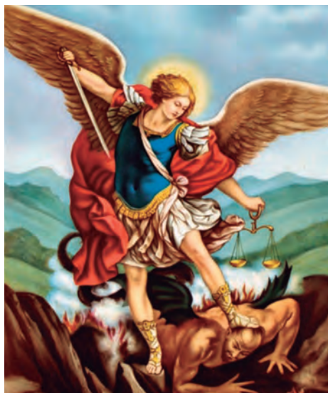
Figura 66. Triunfo del Arcángel Miguel sobre el mal.

Un día de reunión familiar donde se visitan las tumbas de los difuntos para adornarlas y compartir la cosecha con quienes ya se han ido. Se ponen coronas en las cruces adornadas con “pancitas” (ornamento de plástico), cempasúchil, velitas de cebo y el huentle : elotes hervidos de la cosecha recién obtenida y tamales, fruta y bebidas de preferencia del difunto (figura 67).