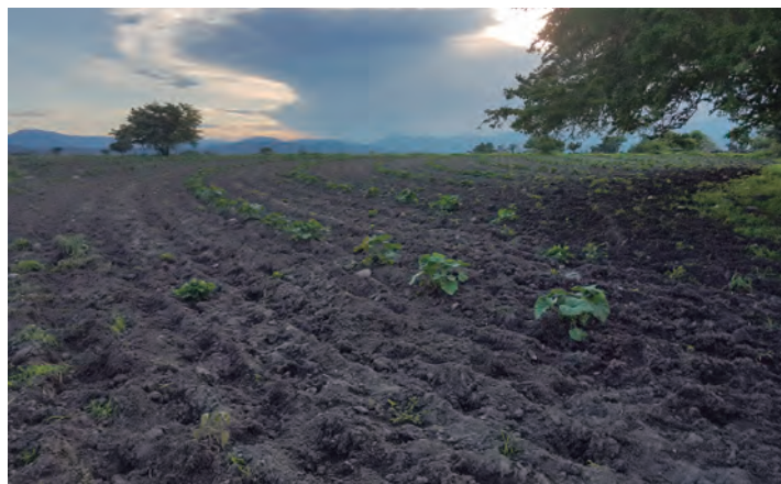
Figura 61. Cultivo de calabaza.

Otras actividades productivas en menor escala, son: el cultivo de calabaza, sorgo y frijol, la explotación de caprinos, cultivos de chile y la recolección de productos forestales (figura 61 y cuadro 13).