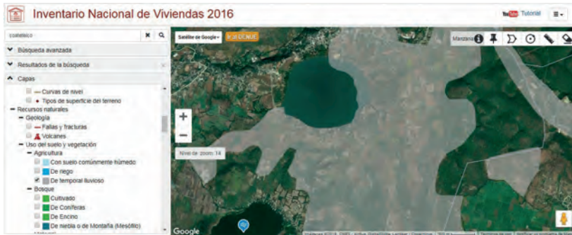
MAPA 2. SUPERFICIE DE SIEMBRA DE TEMPORAL, COATETELCO, 2016