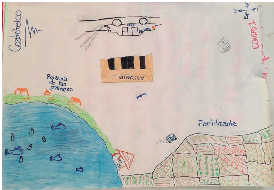
Figura 68. Cartografía de riesgo, Secundaria Técnica Cuauhtlitzin, grupo 1º B.

Sobre el análisis de las cartografías que fueron realizadas por las y los alumnos de secundaria No. 20 Cuauhtlitzin , el problema ambiental más visible que afecta y contamina la tierra en Coatetelco, es el uso en los campos de fertilizantes y herbicidas, (un equipo lo llamó “el veneno en los cultivos”). En su percepción esto no solo daña la tierra sino a ellos mismos, ya que lo que ingieren está contaminado por productos químicos, aguas negras y basura, dado que la gente muchas veces deja su basura en las calles cerca de los sembradíos y al caer la lluvia los desechos se ven arrastrados hacia las cosechas (figura 68).