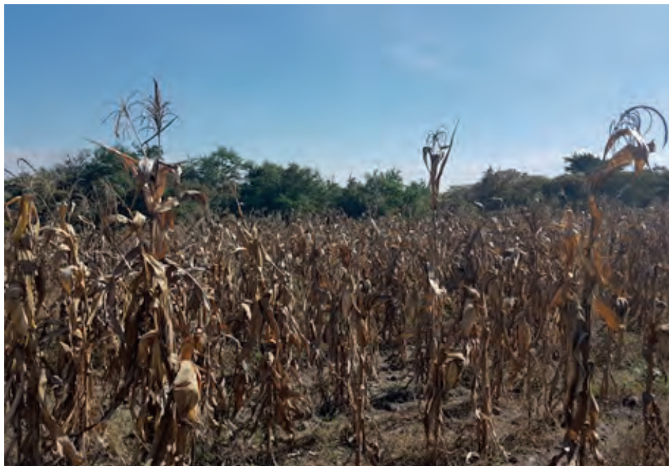
Figura 65. Cultivo de maíz.

Finalizando el temporal, los campesinos que poseen o rentan tierras de riego, abandonan las de temporal para trabajar las de riego. Sin embargo, el riesgo de abandonar las parcelas de temporal es que alguien pase y les eche un cerillo, quemando la cosecha o el ganado.