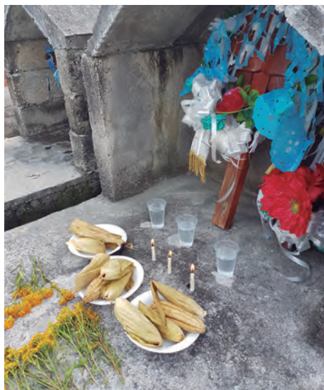
Figura 67. Vísperas de San Miguel.