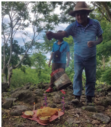
Figura 62. Huentle a los airecitos, Zona Arqueológica de Coatetelco.

Este ritual agrario se realiza el 23 de junio, conectándose paralelamente en el calendario católico con la víspera de la fiesta patronal de San Juan Bautista; los campesinos principalmente se reúnen en alguna casa para preparar la ofrenda o como le llaman, el huentle , que consiste en mole verde de pipián, tamales nejos y la bebida tradicional, xopeli . También se llevan banderitas de ocote que van forradas de hilo/ estambre de diferente color, velitas de sebo, copal y cuetes, todo esto se hace y se sale de la casa a las 12 del día, ahí se dividen en dos grupos para ir a dejar el huentle a los puntos que se sabe están los airecitos (figura 62).