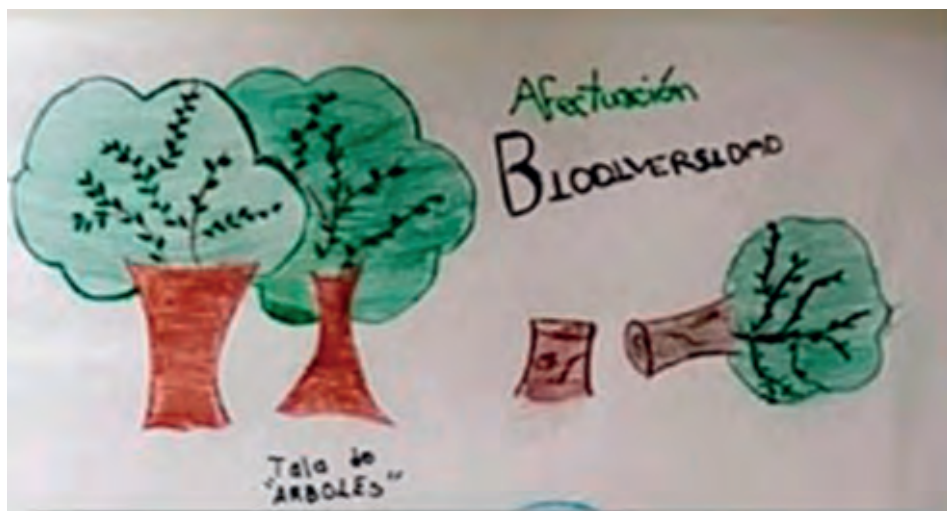
Figura 69. Cartografía de riesgo, Secundaria Técnica Cuauhtlitzin, grupo 1° B.

En los campos matan ardillas, iguanas, lagartijas, conejos... pero más conejos, ya que la iguana está en peligro de extinción (cartografía de riesgo, grupo 1° C, escuela sec. No. 20 Cuauhtlitzin, 2017).