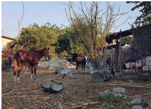
Figura 60. Animales de traspatio.