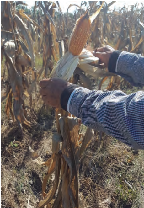
Figura 64. Mazorca de maíz amarillo.

Contrariamente a lo que se piensa que solo importa el maíz en elote o en mazorca, toda la planta se aprovecha, pues las hojas se venden para tamal, los olotes son guardados como combustibles cuando escasea la leña, y el grano que no salió sirve para alimentar a los animales de traspatio, por lo que nada se desperdicia.