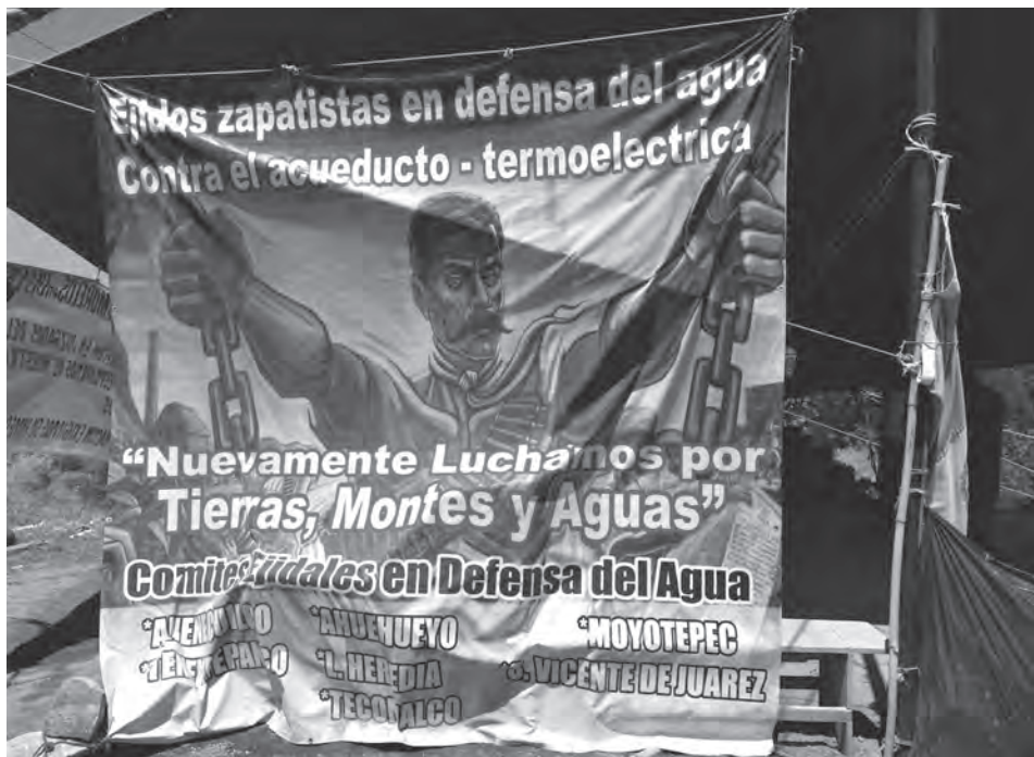
Fig. 1. Campamento Zapatista en Defensa del Agua del Río Cuautla en San Pedro Apatlaco, municipio de Ayala.

Recuperar los elementos que se encuentran en disputa con las visiones hegemónicas, implica dar cabida a una narración alternativa ante lo que se ha llamado: “el silenciamiento estructural del subalterno dentro de la narrativa histórica capitalista” (Spivak, Giraldo, 2003: 298). Por ello, se buscó intencionalmente que las memorias y las realidades del sujeto históricamente subalternizado, fueran narradas en sus propios términos, y que sea a través de esta narrativa, que emerjan la experiencia ontológica e histórico-social de las y los ejidatarios de Ayala.