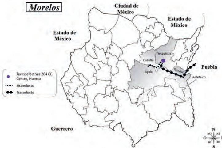
MAPA 1 UBICACIÓN DEL PROYECTO INTEGRAL MORELOS (PIM) EN EL ESTADO DE MORELOS