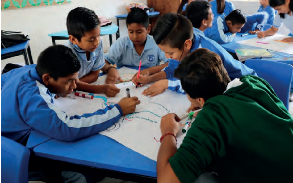
Figura 1. Elaboración cartográfica, alumnos de 2° grado, Telesecundaria Modesto Rangel. Foto: Alegría, Tepetzingo, 2018.