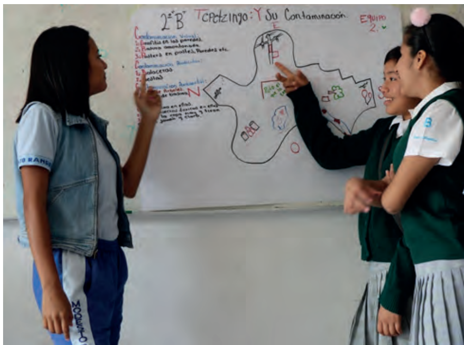
Figura 9. Exposición grupal cartografía de riesgo, grupo 2° B.

Durante la exposición que cada equipo de estudiantes presenta al grupo a partir de su cartografía, la dimensión narrativa reconstruye las realidades de la vida cotidiana tal como son sentidas y vividas por los jóvenes (figura 9).