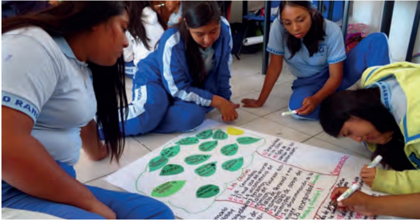
Figura 6. Realización del árbol de problemas, grupo 3° A.

Posteriormente se pidió a los estudiantes que identificaran las principales problemáticas que afectan a su localidad, así como sus causas y consecuencias, y que lo plasmaran en un “Árbol de problemas” (figuras 6 a 8).