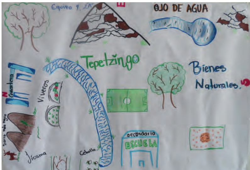
Figura 3. Cartografía ambiental, grupo: 2° A, Telesecundaria Modesto Rangel. Foto: Barreto, Tepetzingo, 2018.