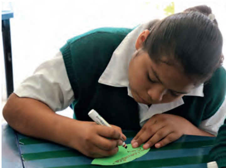
Figura 2. Alumna de 2° grado elaborando una cartografía social, Telesecundaria Modesto Rangel. Foto: Santana, Tepetzingo, 2018.