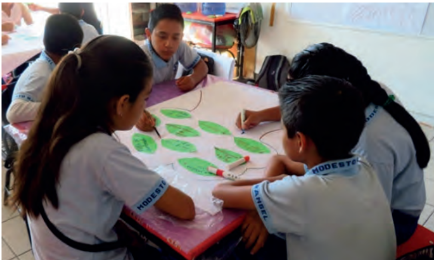
Figura 7. Realización del árbol de problemas, Telesecundaria Modesto Rangel, grupo 2° A. Foto: Alegría, Tepetzingo, 2018.