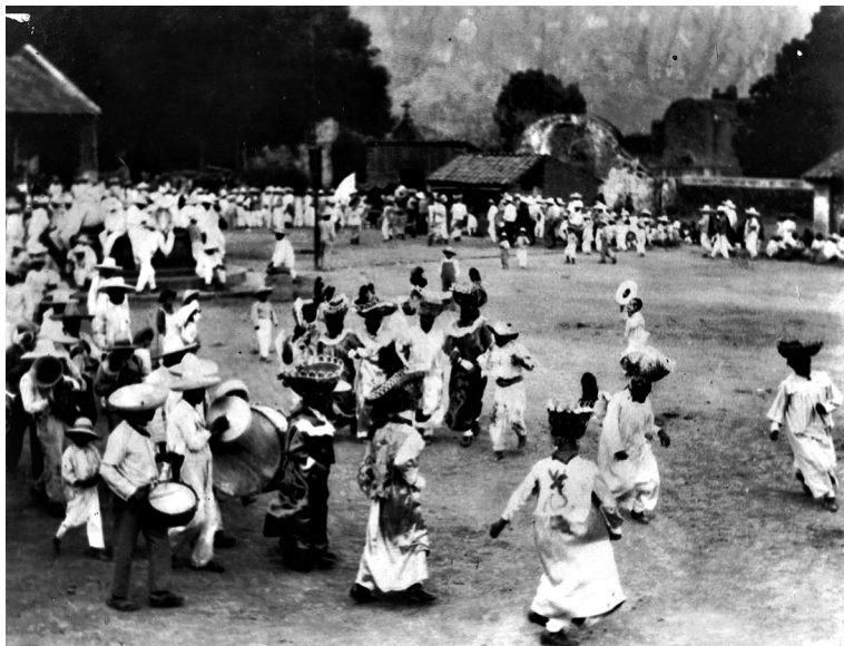
Foto 1. Carnaval de Tepoztlán, circa 1940.

[sic], escasea, sobre todo en los últimos meses de las secas, en que se padece gran penuria por el agotamiento de los pozos y miserables escurrideros de las montañas, que quedan del tiempo de aguas. 34